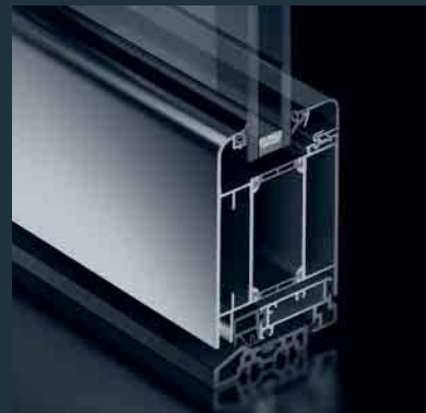
Schüco Tür ADS 65 SL Schüco Door ADS 65 SL

The new Schüco Door ADS 65 is suitable for economical entrance solutions in conjunction with very good thermal insulation. Optional fittings also allow it to be used as a multi-purpose door and integrated in the building security and building management system. In conjunction with the Schüco façade and window systems, the modern design gives the developer numerous design options for the building envelope.