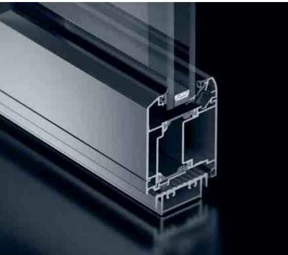
Schüco Tür ADS 65 RL Schüco Door ADS 65 RL